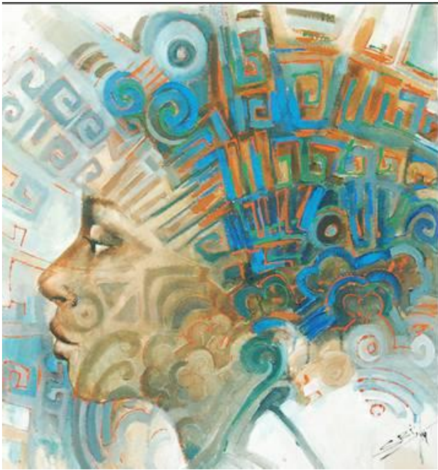
Sri Irodikromo, "Corn Rows I", Mixed media op doek, 66 x 70 cm, 2014

Every other week art critic Rob Perrée discusses a work of art from the collection at Readytex Art Gallery. Today the work 'Corn Rows I', mixed media on canvas, 66 cm wide x 70 cm high, 2014, by Sri Irodikromo.