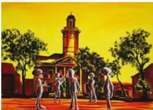
Dhiradj Ramsamoedj, "I Sculpture Paramaribo II", acryl op canvas, 114 x 80 cm, 2013

Vandaag de werken 'I Sculpture Paramaribo II' en 'I Sculpture Paramaribo VI', acryl op canvas, 114 cm breed x 80 cm hoog, 2013, van Dhiradj Ramsamoedj.