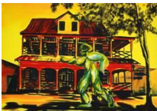
Dhiradj Ramsamoedj, "I Sculpture Paramaribo VI", acrylic on canvas, 114 x 80 cm, 2013

He has been talking about it for years. Dhiradj Ramsamoedj (Paramaribo, 1986) would love to create a sculpture park somewhere around Paramaribo. Or place sculptures at characteristic locations in the city. Just like other plans of such a dreamy nature, it's difficult to have them realized. They usually get stuck somewhere in the sketch phase and then quietly disappear in an ever greedy drawer.