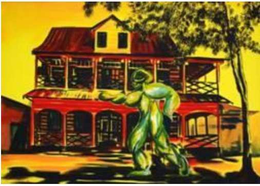
Dhiradj Ramsamoedj, "I Sculpture Paramaribo VI", acryl op canvas, 114 x 80 cm, 2013

Hij praat er al jaren over. Dhiradj Ramsamoedj (Paramaribo, 1986) zou graag een beeldentuin aanleggen in de omgeving van Paramaribo. Of beelden plaatsen op karakteristieke plekken in de stad. Zoals bij veel plannen met een hoog droomgehalte, is het moeilijk ze gerealiseerd te krijgen. Ze blijven meestal in de schetsfase steken en verdwijnen stilletjes in een al te gulzige la.